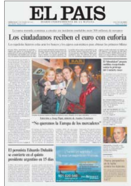
La portada del 2 de enero de 2002 con la puesta en circulación del euro.

la productividad de sus trabajadores y en la innovación tecnológica de sus empresas.