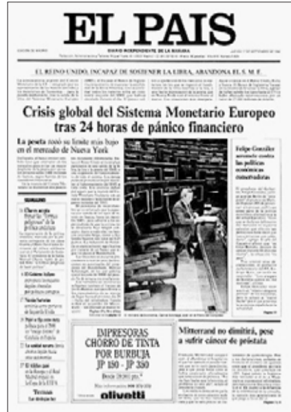
Tormenta monetaria en la primera página del diario del 17 de septiembre de 1992.

Deben hacerse también todos los esfuerzos necesarios en el proceso de reformas estructurales y en la promoción de la innovación tecnológica y el desarrollo del capital humano. Un país con el nivel de renta per cápita que tiene hoy España ha de basar su ventaja comparativa cada vez más en