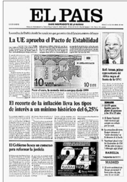
El Pacto de Estabilidad, en la primera página del 14 de diciembre de 1996.