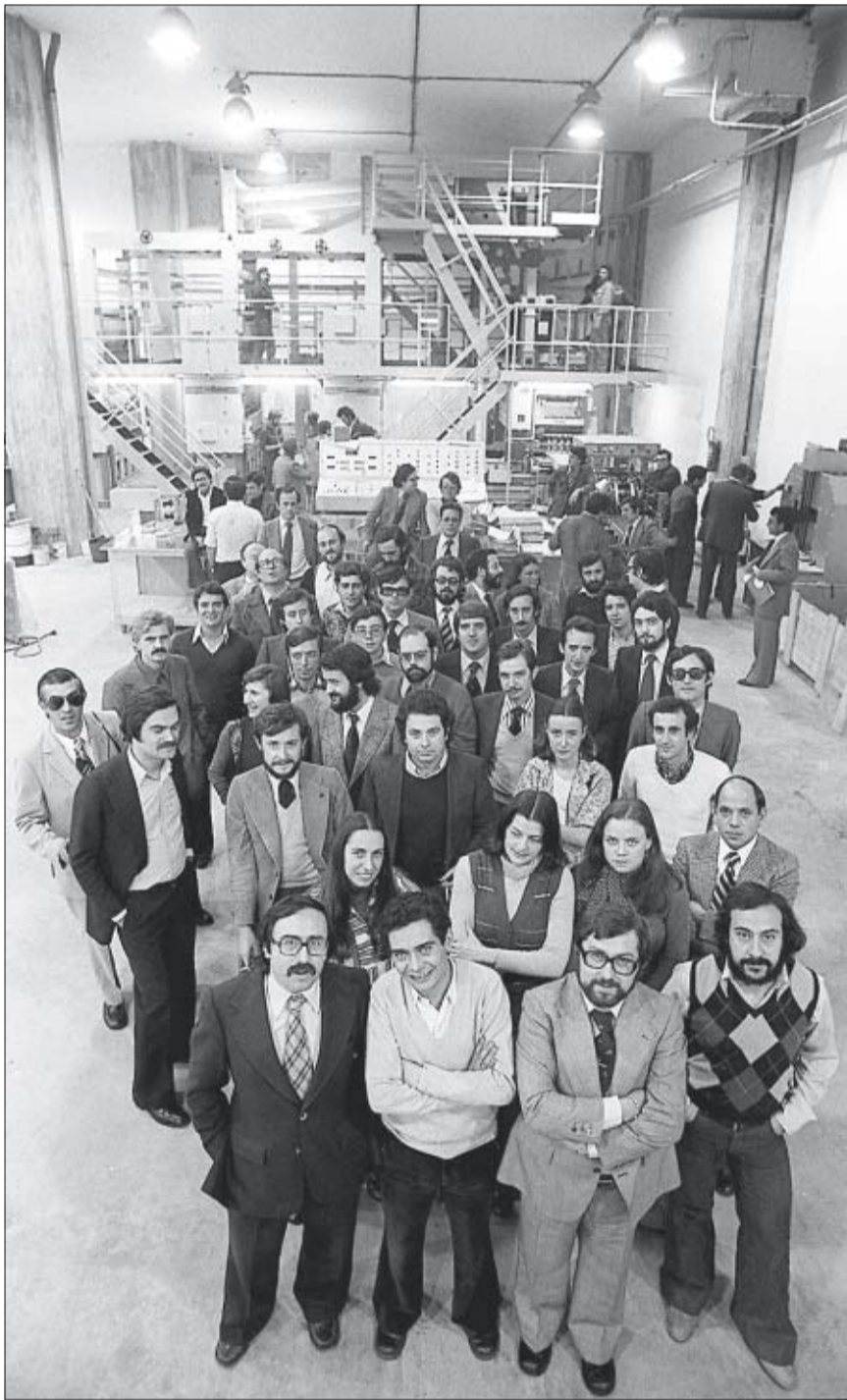
Fotografía de la Redacción de EL PAÍS tomada en la rotativa días antes de la salida del periódico, el 4 de mayo de 1976.