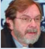
Juan Luis Cebrián