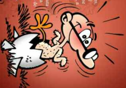
En el álbum El 35 aniversario , Ibañez cuenta toda la verdad sobre el nacimiento de Mortadelo.

En 1993 Mortadelo y Filemón cumplieron 35 años, y la efeméride se celebró por todo lo alto. En el álbum El 35 aniversario , Ibañez decidió rendirse un original y divertido homenaje en el que, a su manera, explicó tanto su vida profesional como la de sus criaturas. En esta aventura, por la que se puean Mortadelo y Filemón como intruidos de honor, conocemos sus duras condiciones profesionales de Ibañez y su absoluta dedicación al trabajo, así como el momento y la forma en la que nacieron, aparte de los agentes de la T.I.A., otros de sus populares personajes y series, como J.3: nie del Percebe , La familia Trapusonda , el hotones Sacarino, Rompedichos o Pepe Goterra y Otilio.