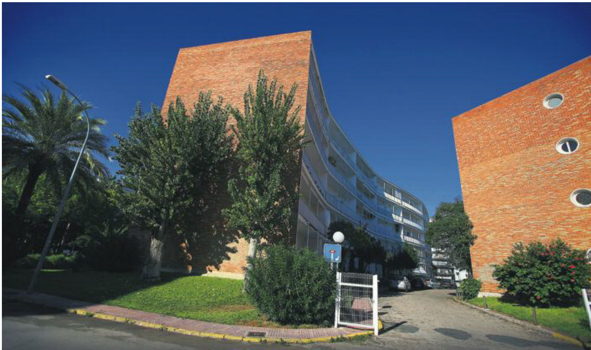
La Colònia Ducal, a la platja de Gandia, obra de Juan José Estellés, en col·laboració amb Pablo Soler i Francisco García.