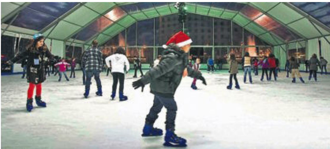
La pista de patinatge instal·lada a la plaça de Catalunya, de Barcelona.