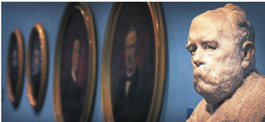
Exposició dedicada a Teodor Llorente al Museu Valencià de la Il·lustració i de la Modernitat.