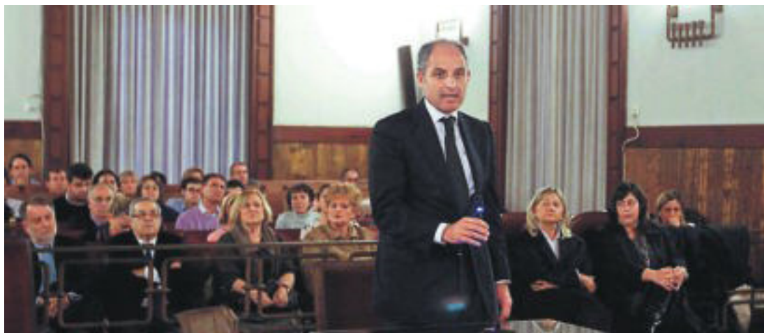
Francisco Camps en una imatge del judici.

perquè la nefasta gestió del senyor Camps i els seus adlèters ha deixat massa factures per pagar, i, tant si les volem veure com si no, ens tocarà pagar-les ara, en plena crisi. La brutal dilapidació dels diners públics que durant anys aquesta administració s'ha consentit té conseqüències que no es poden amagar i que haurem de suportar com els autèntics Jobs d'aquesta trista història. Un problema afegit és que n'ha de fer, el reivindicat Francisco Camps, ara que el seu successor vol posar una mica d'ordre en el ruïnós desfici que ha rebut com a herència. ¿Observarà impàvid com un gestor sensat (i forçat per les penoses circumstàncies) desmantella els seus deliris? Intentarà tornar en olor de