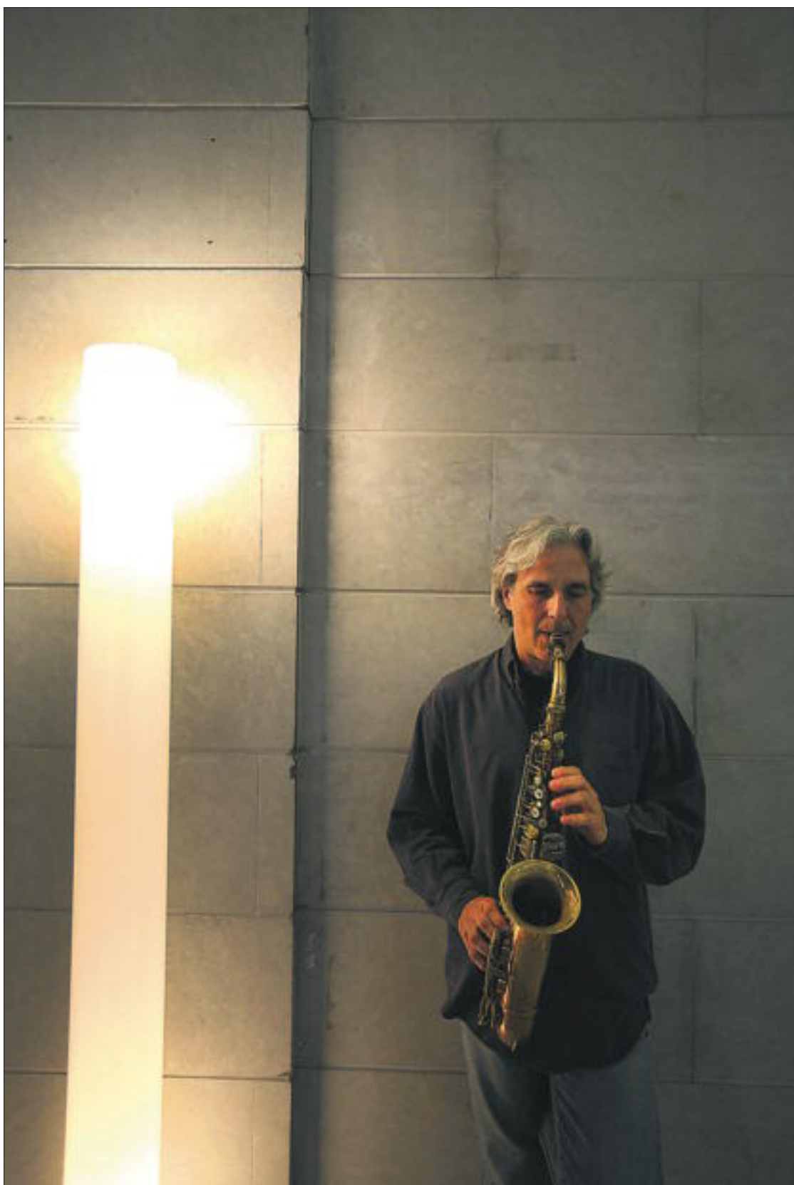
El músic de jazz Perico Sambeat.