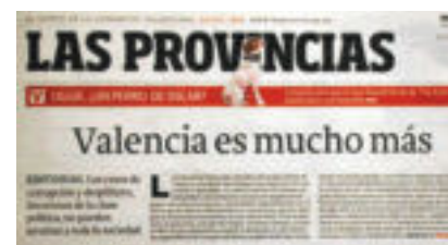
L'editorial de Las Provincias.