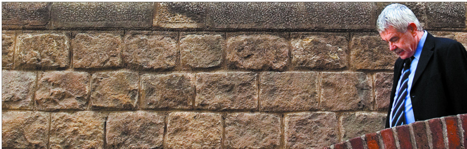
El ex presidente catalán Pasqual Maragall, ayer, en el hospital Sant Pau de Barcelona, en el que anunció su retirada de la primera línea política para luchar contra el alzheimer.