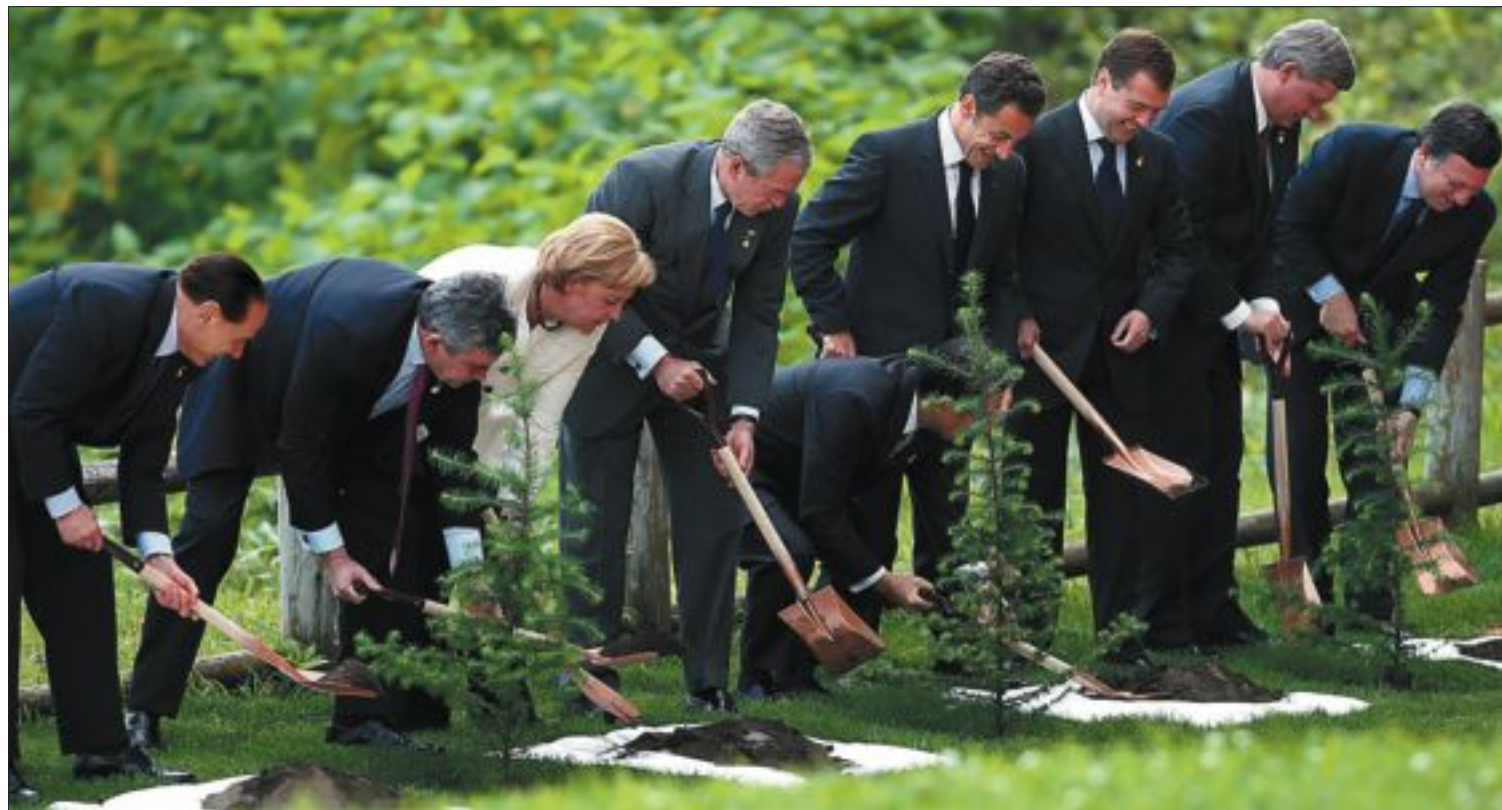
EL G-8 REACCIONA ANTE EL CAMBIO CLIMÁTICO. Los países más ricos acordaron ayer rebajar al menos un 50% las emisiones de gases contaminantes antes de 2050 para poner freno al calentamiento global. Para ello, esperan que las potencias emergentes, como China e India, se impliquen en la medida. En la imagen, los mandatarios del G-8 participan en una plantación de árboles en Toyoko, Japón. PÁGINAS 2 A 4