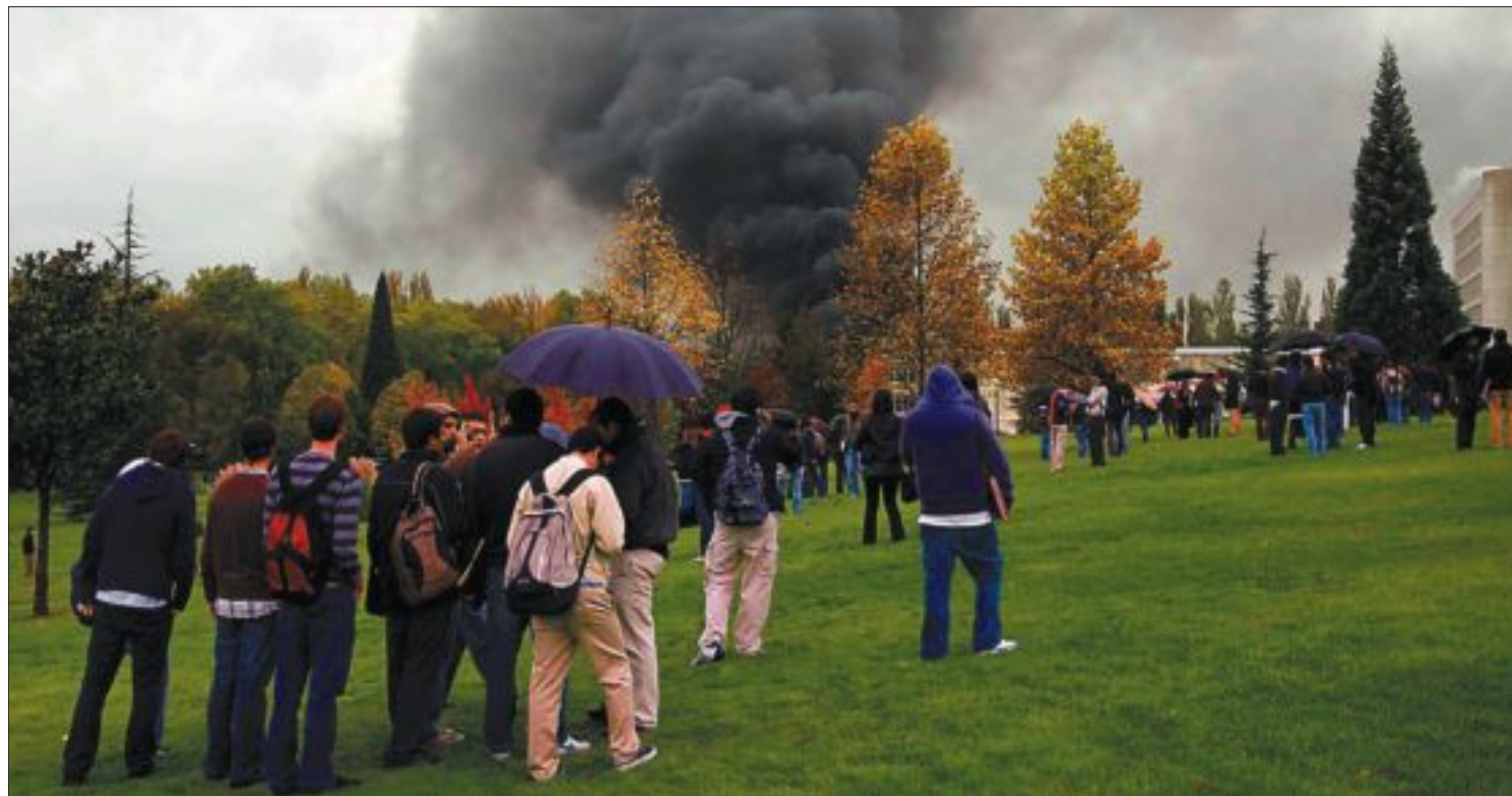
Estudiantes de la Universidad de Navarra observan la columna de humo provocada por la explosión del coche bomba.