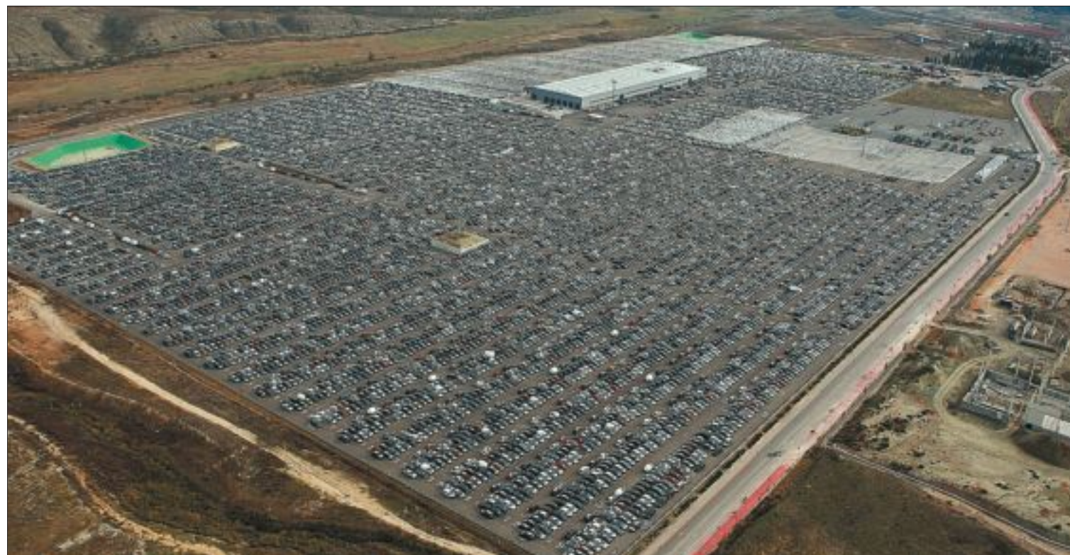
NO HAY QUIEN COMPRE UN COCHE. La crisis castiga al sector del automóvil, que ha suprimido ya miles de empleos. La UE se plantea ayudas, mientras decenas de miles de coches sin vender abarrotan zonas logísticas como la de Ciempozuelos, en Madrid. PÁGINA 24

En EE UU el secretario del Tesoro, Henry Paulson, admitió que su plan de rescate no podrá evitar una crisis aguda de la economía real. PÁGINAS 24 Y 27