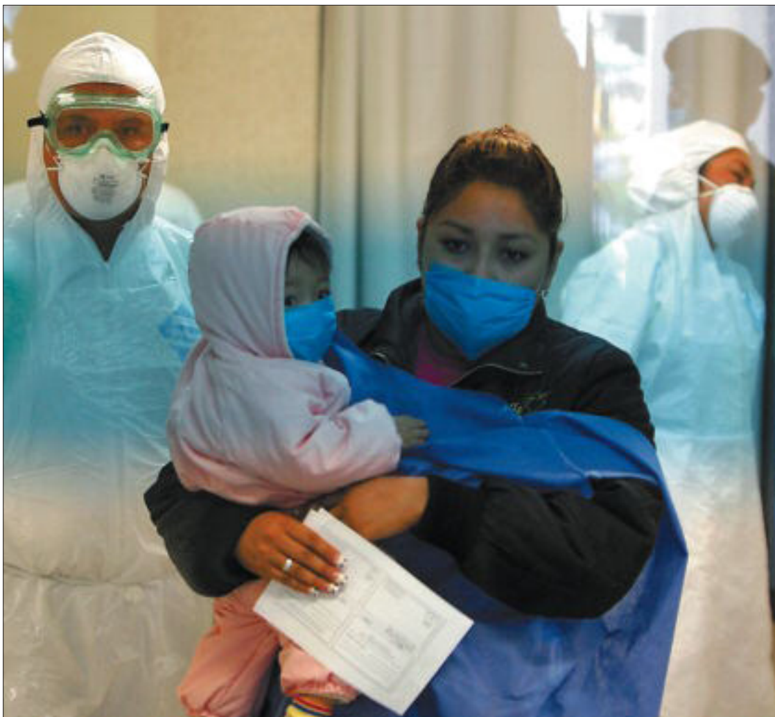
TODO ES POCO FRENTE AL VIRUS. México ha abierto centros especiales para acoger a las personas sospechosas de estar infectadas. En la foto, una mujer y su hijo son atendidos en el hospital Naval de la capital.

En España son ya 10 los contagiados y 70 los casos sospechosos. Francia ha pedido que se suspendan los vuelos con México. La UE prevé fallecimientos por el virus. PÁGINAS 32 A 38