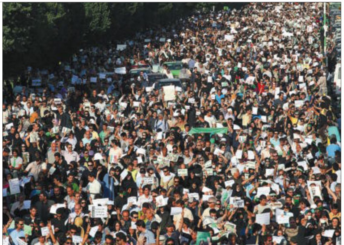
Decenas de miles de seguidores del líder reformista Mir Hosein Musaví se manifiestan ayer en Teherán.