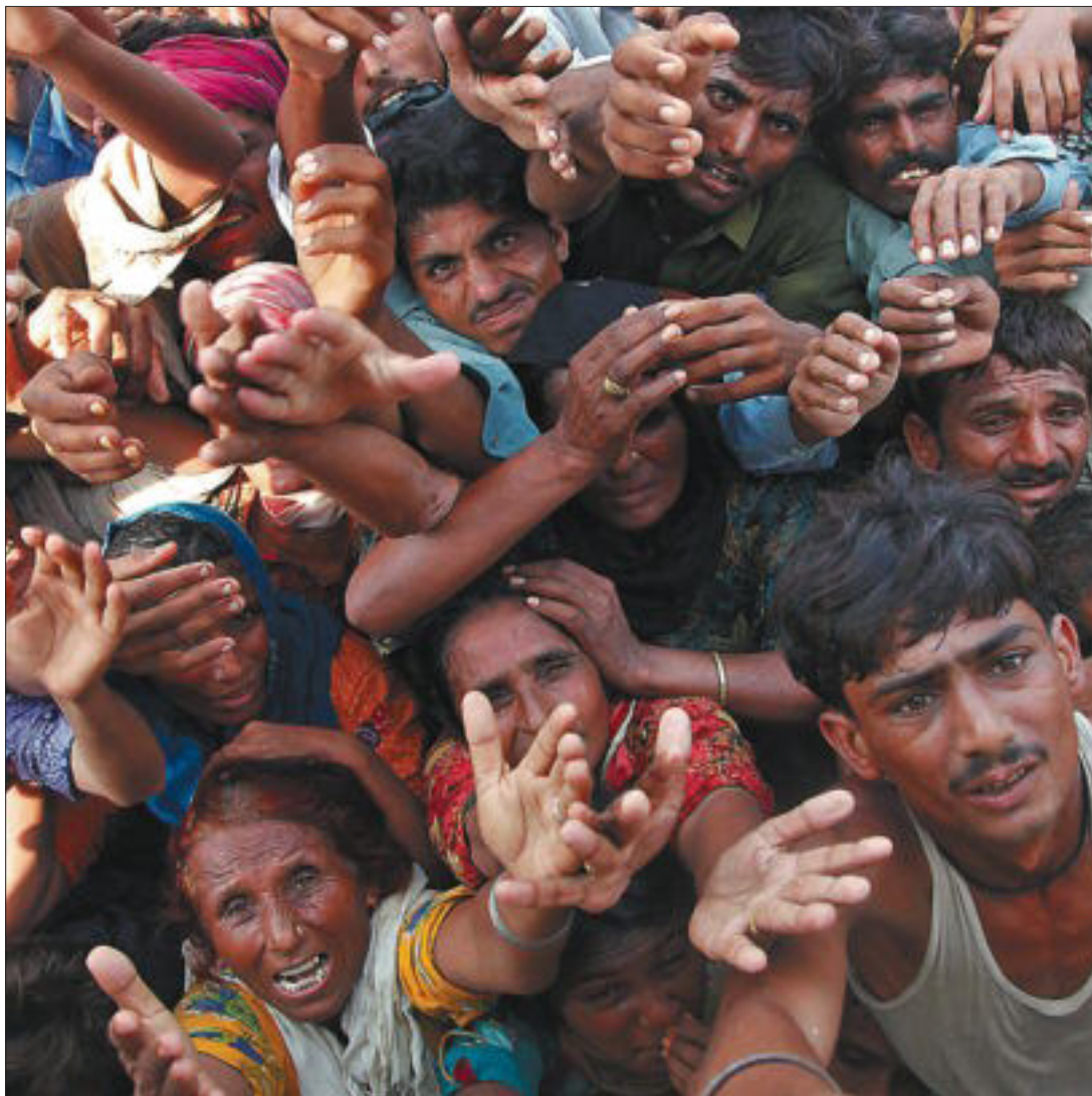
Los paquistaníes se agolpan para recibir la escasa ayuda que llega al pueblo de Karambad Qureshi.