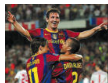
Messi fue autor de tres goles.

Última entrega de la serie 'Los agujeros negros del planeta' Por Javier Ayuso